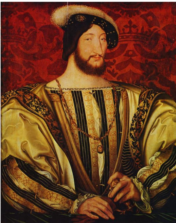
Portrait de François Ier en buste, Jean Clouet, vers 1525. Paris, Musée du Louvre